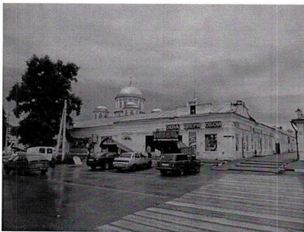
Общий вид ул.ул. Мира - Интернациональная