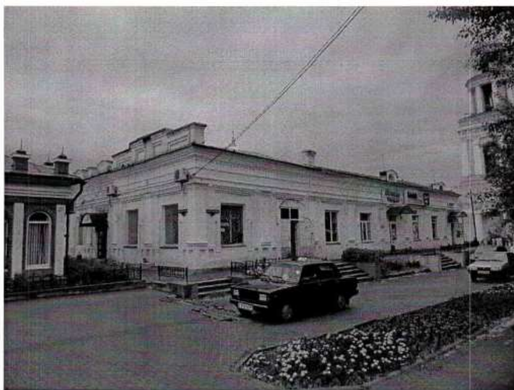
Общий вид. Ул.ул.Советская-Мира