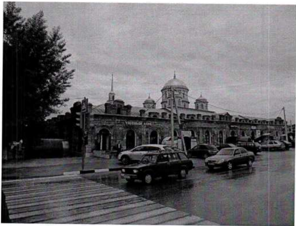
Общий вид ул. ул. Интернациональная - Почтовая