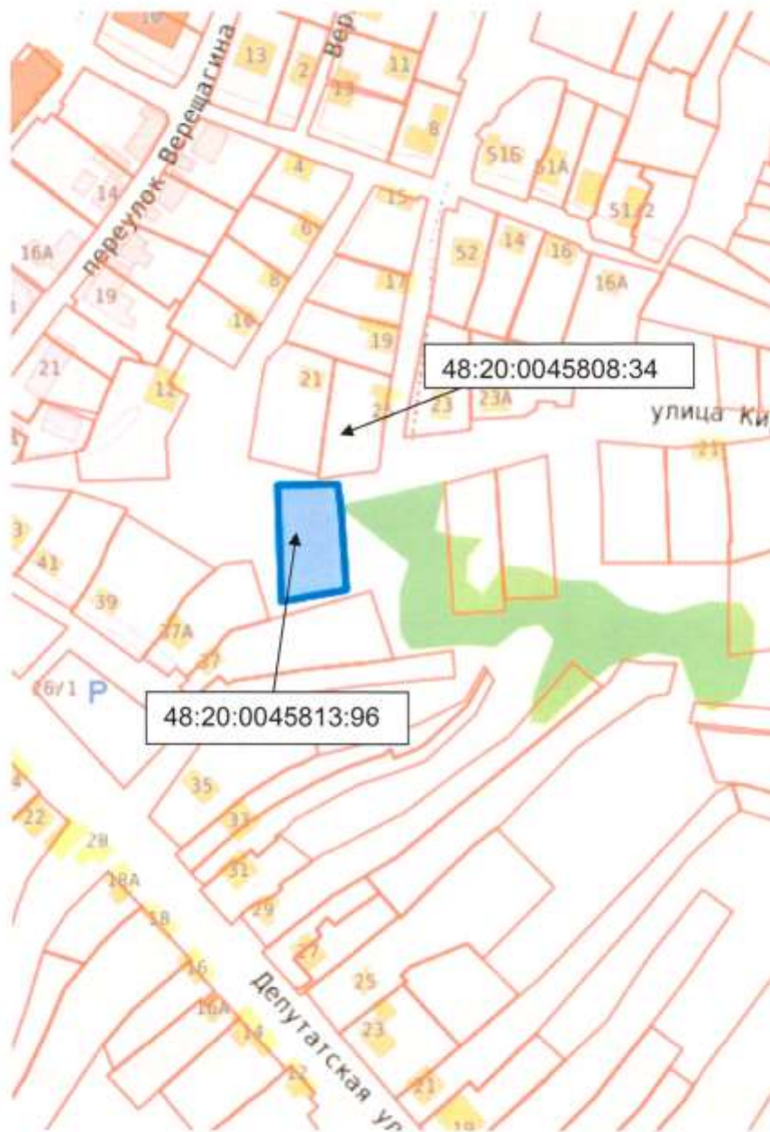
Схема расположения земельного участка в окружении смежно расположенных земельных участков (ситуационный план)